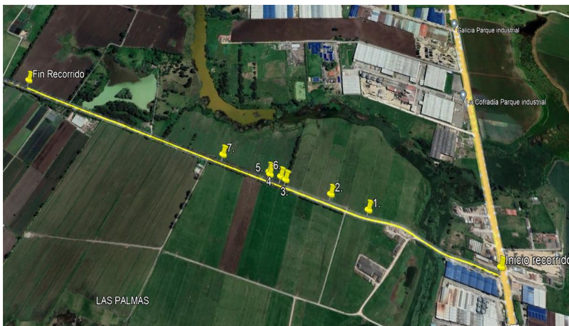
Ilustración 1. Recorrido verificación ambiental -Vereda El Cacique

Se realizó recorrido de control y vigilancia de los componentes ambientales en áreas rurales del municipio de Funza, vereda El Cacique, el día 25 de abril de 2024, desde las Coordenadas 4°43'28.35"N - 74°11'37.61"W hasta las coordenadas 4°44'33.09"N - 74°12'6.15"W (ver ilustración 1. Ruta amarilla), con el fin de verificar las condiciones ambientales, identificar posibles afectaciones a los recursos naturales y realizar las acciones de prevención correspondientes.